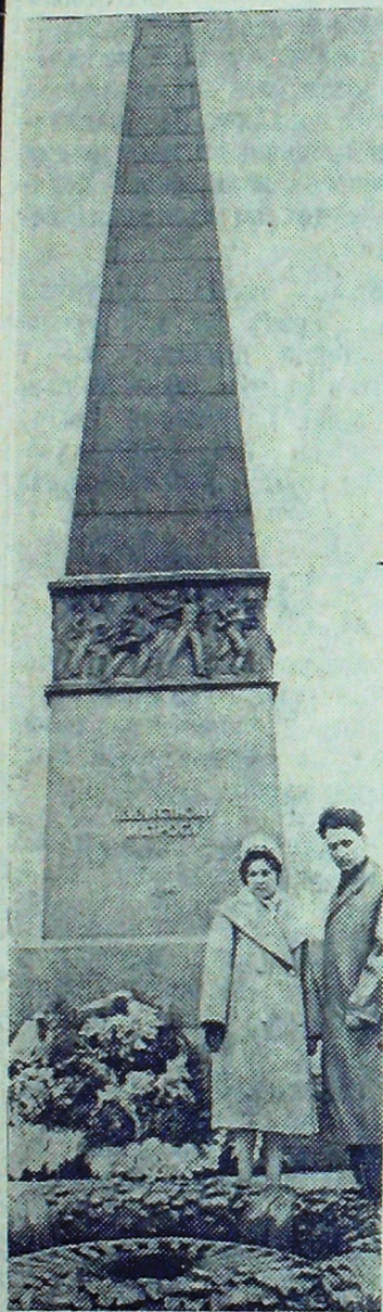
Дорогой ценой заплатил наш народ за победу в Великой Отечественной войне. Свято хранят советские люди память о погибших воинах.

НА СНИМКЕ: у памятника Неизвестному матросу в Одессе.