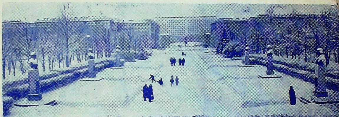
Ленинград. В честь победы над гитлеровской Германией трудящиеся Ленинграда заложили 7 октября 1945 года в Московском районе Парк Победы. За двадцать лет он разросся и стал любимым местом отдыха. Центральная аллея парка названа Аллеей Героев. Здесь установлены скульптурные бюсты дважды Героев Советского Союза — ленинградцев, прославившихся своими подвигами в дни Великой Отечественной войны.

На снимке: Аллея Героев в Парке Победы Московского района.