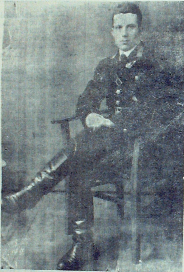
Снимок Г. А. Жовтоножки.

хотворение о бессмертном подвиге летчика. Автор пожелал остаться неизвестным. Вот некоторые строки из этого произведения - клятвы: